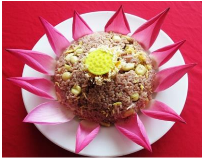
Cơm gạo huyết rồng