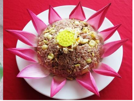
Cơm gạo huyết rồng

CN C.TY CP DU LỊCH ĐỒNG THÁP- TRUNG TÂM ĐIỀU HÀNH DU LỊCH 04 Đốc Binh Kiều, Phường 2, TP.Cao Lãnh, Đồng Tháp Tel: 0277.3873 026 – 6559 692 Hotline: 0919.239383 ( Ms Hà )