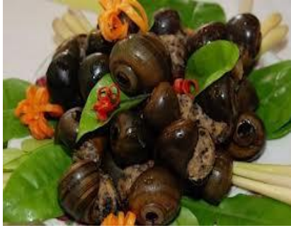
Ốc hấp tiêu