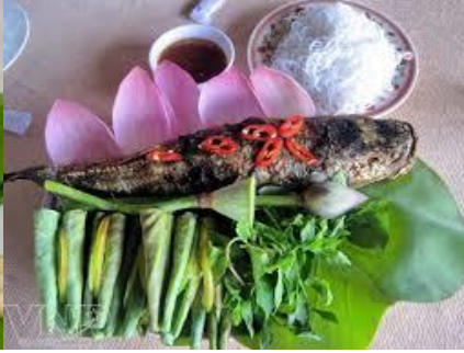
Cá lóc nướng cuốn lá sen non