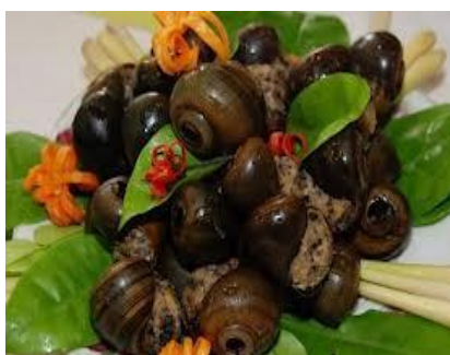
Ốc hấp tiêu