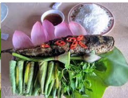
Cá lóc nướng cuộn lá sen non