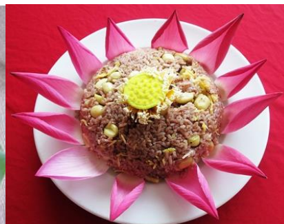
Cơm gạo huyết rồng

CN C.TY CP DU LỊCH ĐỒNG THÁP- TRUNG TÂM ĐIỀU HÀNH DU LỊCH 04 Đốc Bình Kiều, Phường 2, TP.Cao Lãnh, Đồng Tháp Tel: 0277.3873 026 – 6559 692 Hotline: 0919.239383 ( Ms Hà )